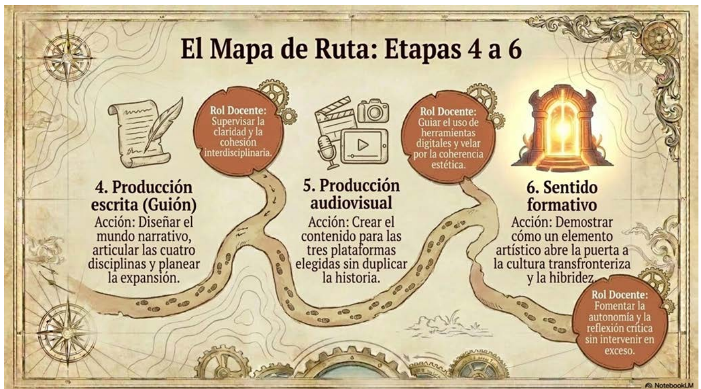
Peyuk, R. A. (2026). El mapa de ruta: etapas 4 a 6 [Imagen generada por IA]. Notebook IA.