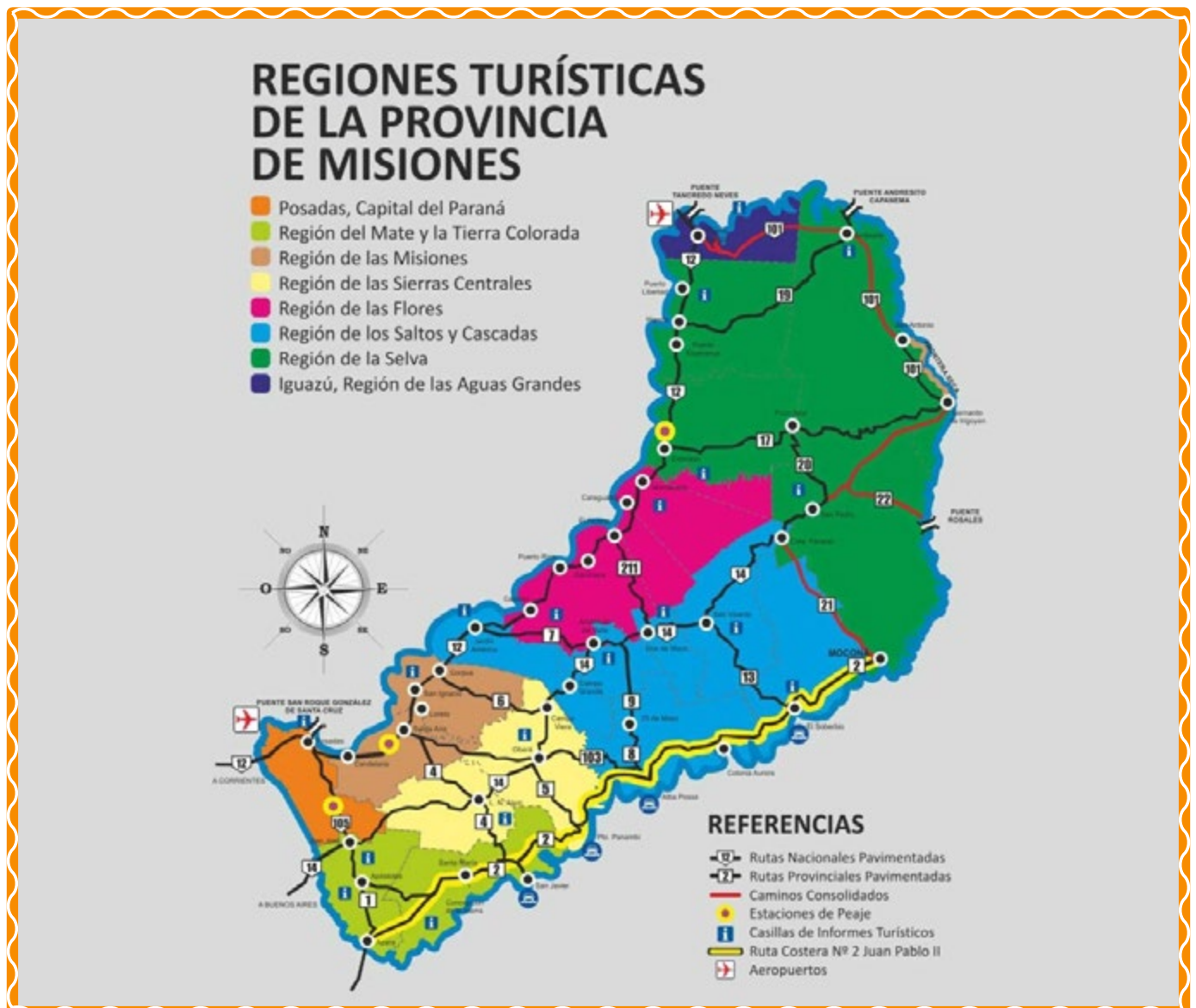
Imagen 2: Regiones turísticas de la Provincia de Misiones

Entonces, ¿podemos hablar de regiones turísticas? Analicen y debatan según las lecturas de BOULLÓN.